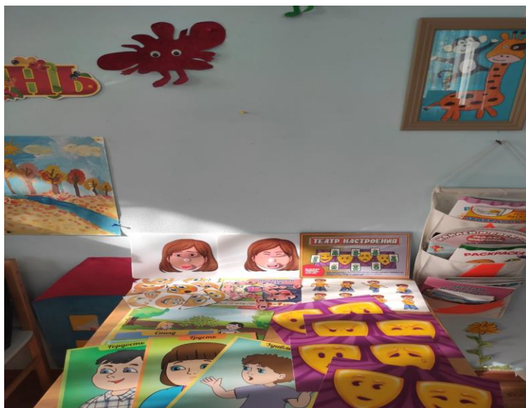
8 Эмоционально – коммуникативная игра «Азбука настроений».